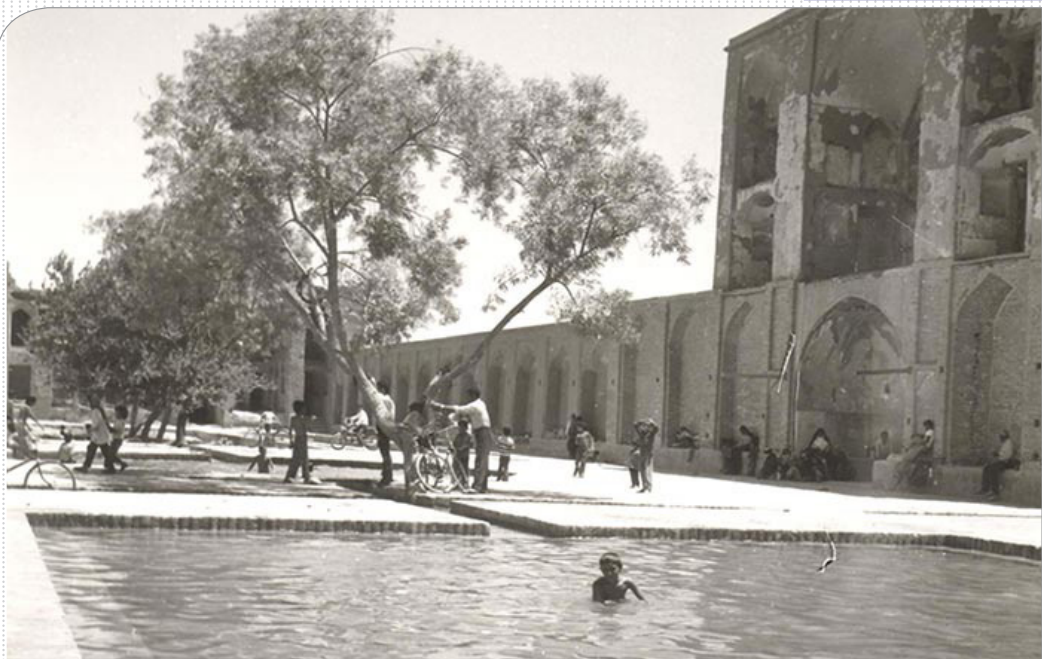
آب تنی کودکان یزدی در استخری در باغ جهانی دولت آباد. آب این استخر از قنات قدیمی و تاریخی باغ تامین می شد. سایت یزدنگار این عکس را منتشر کرده است. عکس حوالی دهه ۵۰ ثبت شده است.